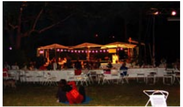
Le dernier jour, Ursule et Pétula nous ont conviés à un grand banquet...