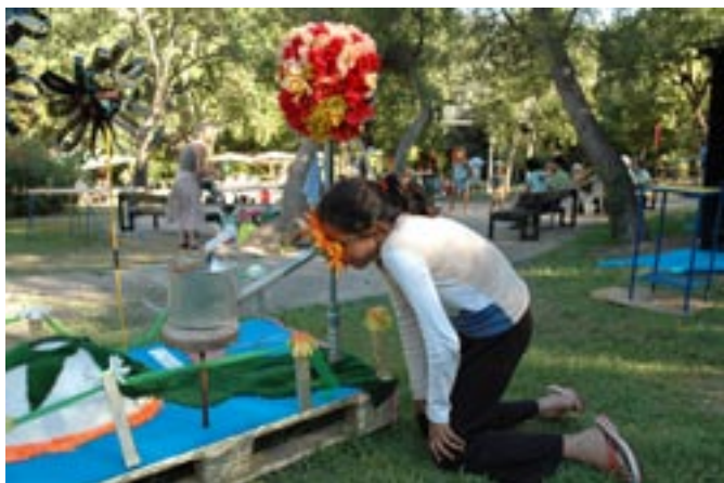
Le jardin optique. Quand on se penche sur le cœur des fleurs, on voit des choses...