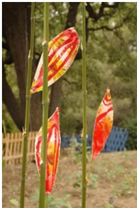
Les bambous de Béatrice Bonhomme.