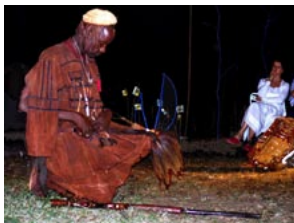
...nous proposons des démonstrations de danses de coutumes.