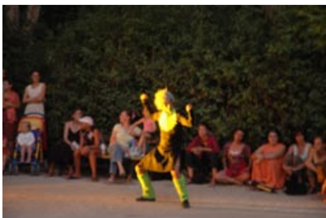
Danse. S' , Cie Maddai (Italie)