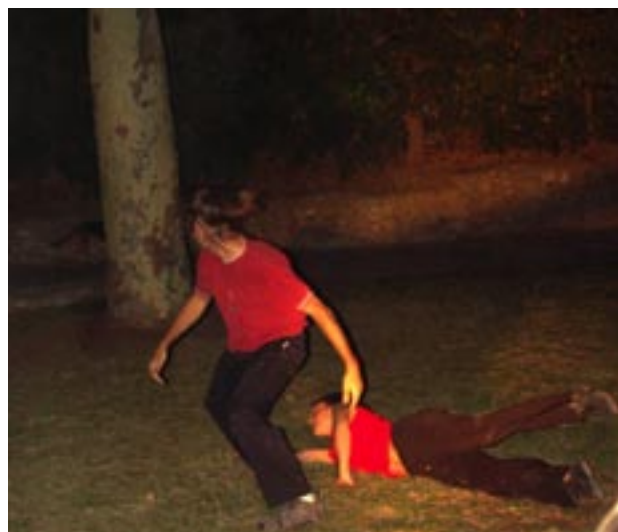
Danse. Déambulation , le GRC (France)