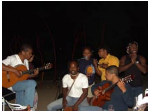
Le banquet, suite, avec le Milenio et sa «musique d'esclaves» (Lima, Pérou).