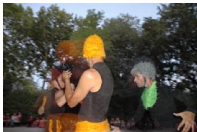
Danse. S' , Cie Maddai (Italie)