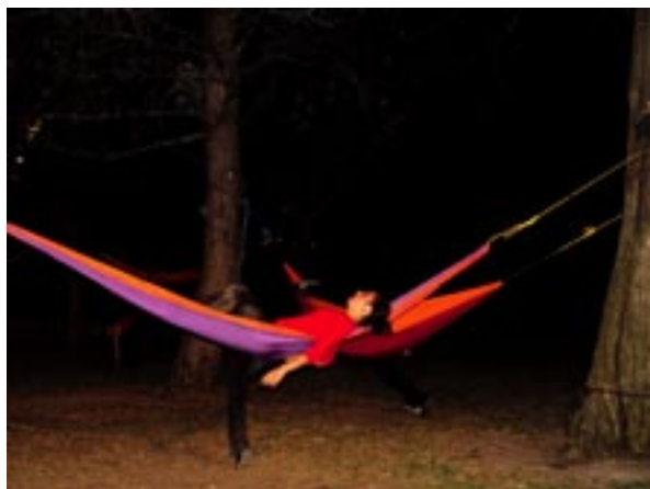
Danse. Le GRC, naissance d'une danseuse dans son hamac-chrysalide.