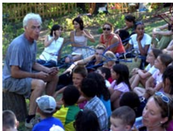
Contes d'Afrique par Jean Louis Favier