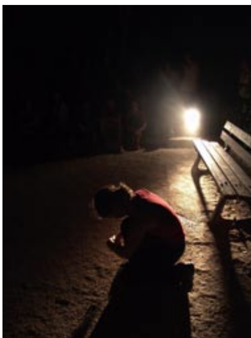
Danse. GRC (France)