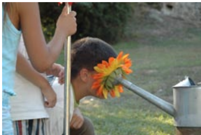
et des choses.