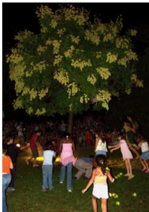
Deux minutes plus tard, un spectacle imprévu : à la fin d' Adam et Eve les enfants se précipitent et rafflent les centaines de pommes tombées du ciel.