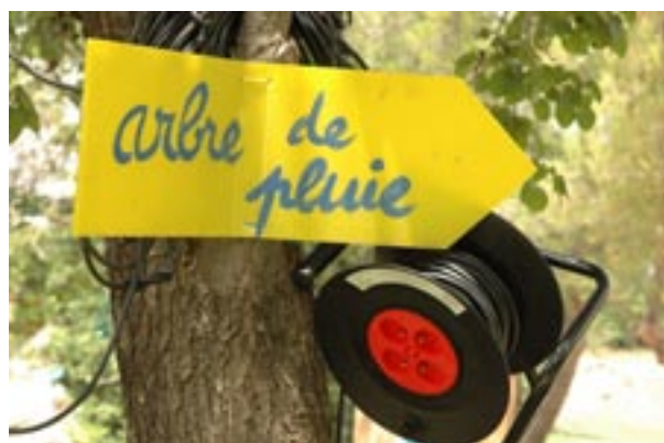
Quand il fait trop chaud...