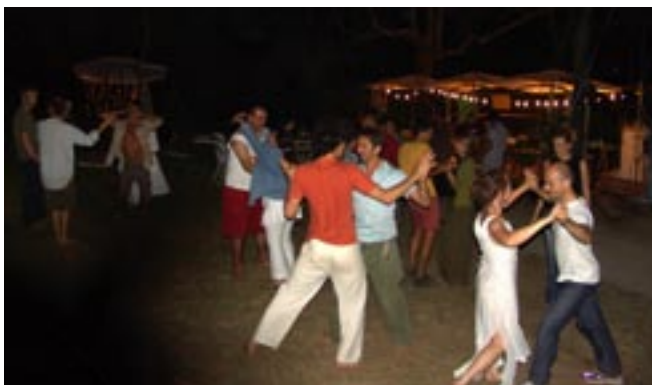
Le banquet, fin.