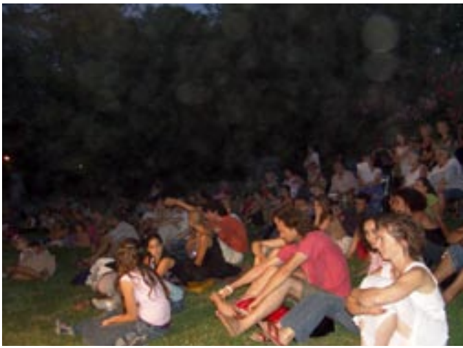
22h, un autre jour : re-cinéma.