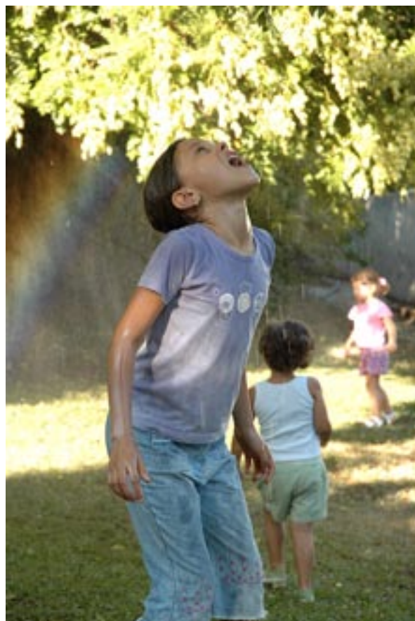
on va sous l'arbre de pluie.